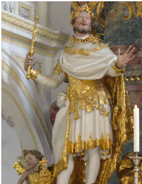
Heinrich am Hochaltar der Pollinger Stiftskirche von Johann Baptist Straub, 1763/65

Am 16. April jährt sich zum 1000. Mal jener für unsere Heimatstadt so denkwürdige Tag, an dem Kaiser Heinrich II. dem Kloster Polling alle infolge der Ungarnstürme verloren gegangenen Güter, darunter auch die Besitzungen im Dorfe Weilheim, restituierte.