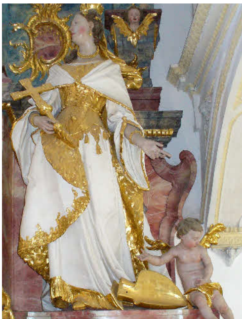
Kunigunde am Hochaltar der Pollinger Stiftskirche

Und weil gerade schon die Rede von ihrem Sterbetag, dem 3. März, war, so sei hier eine alte Wetterregel erwähnt: „Kunigund macht warm vo unt“, was so viel bedeutete, dass nun der Frost im Boden zu weichen begann und die Erde langsam auftaute. Allerdings ist dieser Spruch seit der Kalenderreform des II. Vatikanischen Konzils nicht mehr gültig. Denn heutzutage gedenkt die Kirche der Heiligen gemeinsam mit Heinrich am 15. Juli – und somit dürfte der Spruch vielleicht nur noch für Gebiete mit sibirischen Temperaturen seine Berechtigung haben. Papst Eugen III. erhob Heinrich am 12. März 1146 zur Ehre der Altäre, und am 29. März 1200 wurde durch Papst Innozenz III. auch Kunigunde in die Schar der Heiligen aufgenommen.